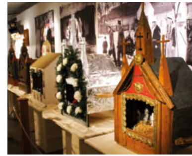
Ausstellung im Stadtmuseum.

über „Ouklopfe“ aller Geister – Hohenloher Bräuche von Advent bis Dreikönig im Stadtmuseum berichten. Es wird um Anmeldung gebeten: stefan.kraut@kuenzelsau.de, 07940 129-117.